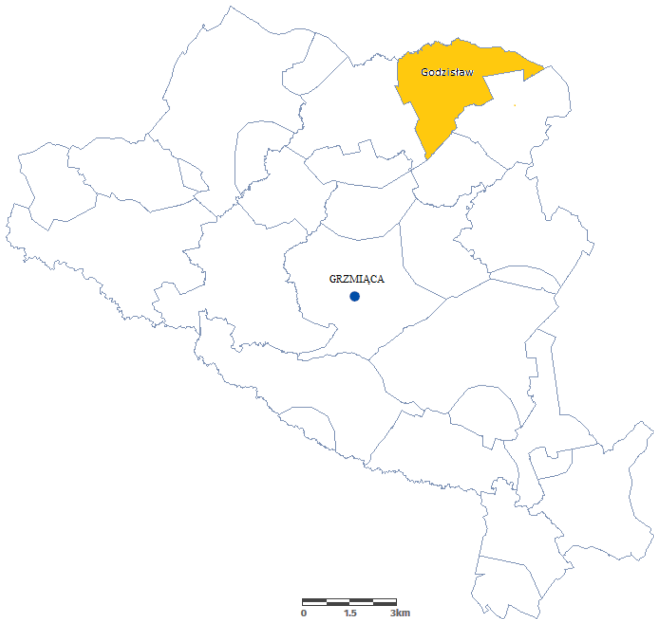
Mapa sytuacyjna położenia Sołectwa Godziszów w Gminie Grzmiąca