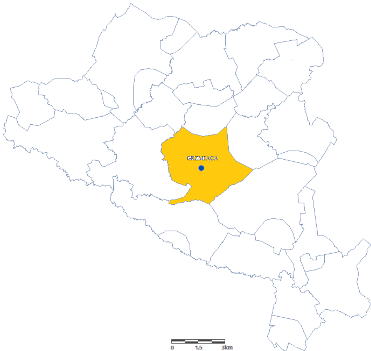
Mapa sytuacyjna położenia Sołectwa Grzmiąca w Gminie Grzmiąca