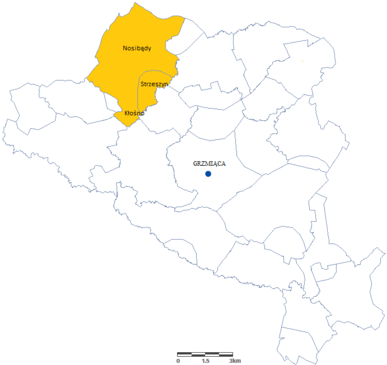
Mapa sytuacyjna położenia Sołectwa Nosibądy w Gminie Grzmiąca