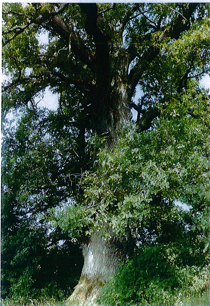
Rys.5. Dąb w Kamionce

Na terenie Gminy Grzmiąca występuje kilkanaście drzew – pomników przyrody . Najważniejszym jest dąb szypułkowy w Kamionce o obwodzie 730 cm i wysokości 15 m (jest drugim pod względem grubości drzewem w powiecie szczecińskim). Innym ciekawym drzewem jest dąb, który rośnie w Godziszawiu. Wiek drzewa – ok. 250 lat, obwód - 445 cm, wysokość 21 m.