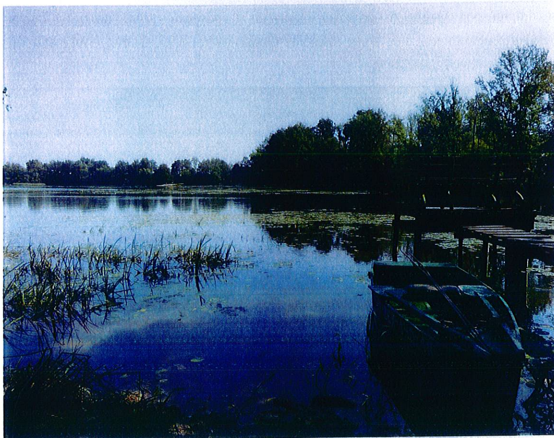
Rys.4. Jezioro Baczyno

Charakterystyczną cechą krajobrazu gminy - bądź co bądź leżącej na pojezierzu - jest nieomal całkowity brak jezior. Dwa większe jeziora – Baczyno i Baczynko to zbiorniki zaporowe utworzone w ramach dużego kompleksu hydrotechnicznego zbudowanego w celach melioracyjnych na rzece Łozica na przełomie XIX i XX wieku.