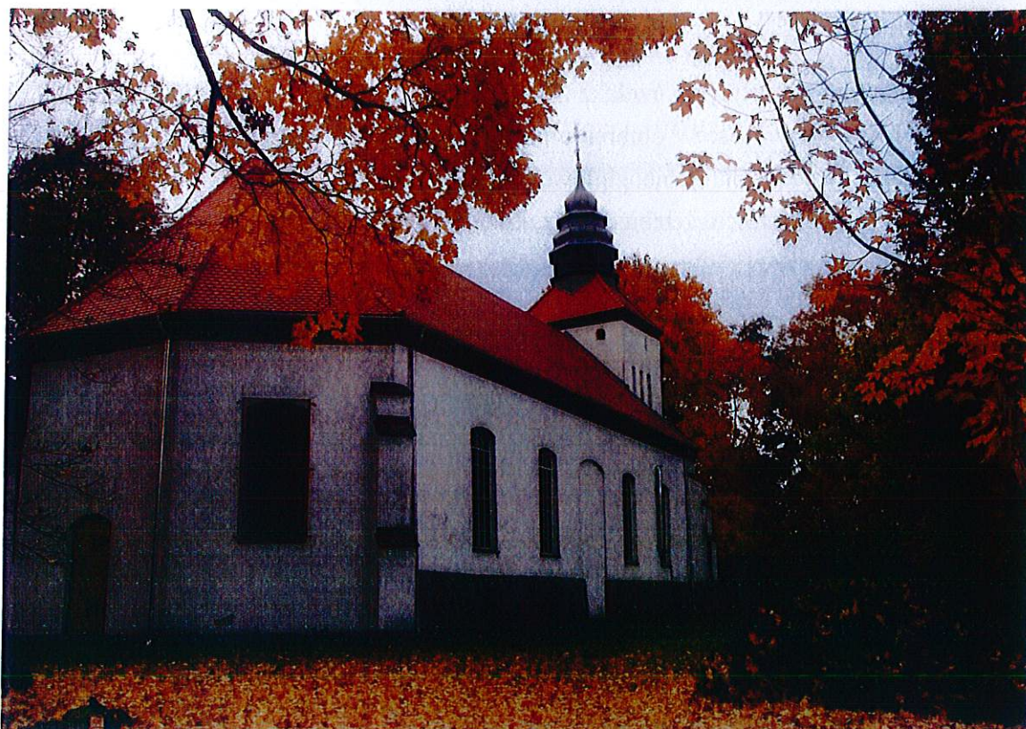
Rys.7. Kościół w Grzmiącej