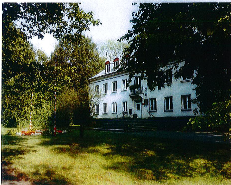
Rys.3. Część parku pałacowego z obecnym budynkiem Urzędu Gminy

Po wyzwoleniu Pomorza w marcu 1945 roku region ten wszedł w skład II okręgu administracyjnego Ziemi Odzyskanych, a w maju 1946 roku w skład województwa szczecińskiego. Od czerwca 1950 roku obszar gminy należał do utworzonego województwa koszalińskiego (w powiecie szczecineckim do 1975 roku, kiedy to zlikwidowano powiaty). Od 1 stycznia 1999 roku gmina Grzmiąca wchodzi w skład nowego województwa zachodniopomorskiego i ponownie znajduje się na obszarze powiatu szczecineckiego.