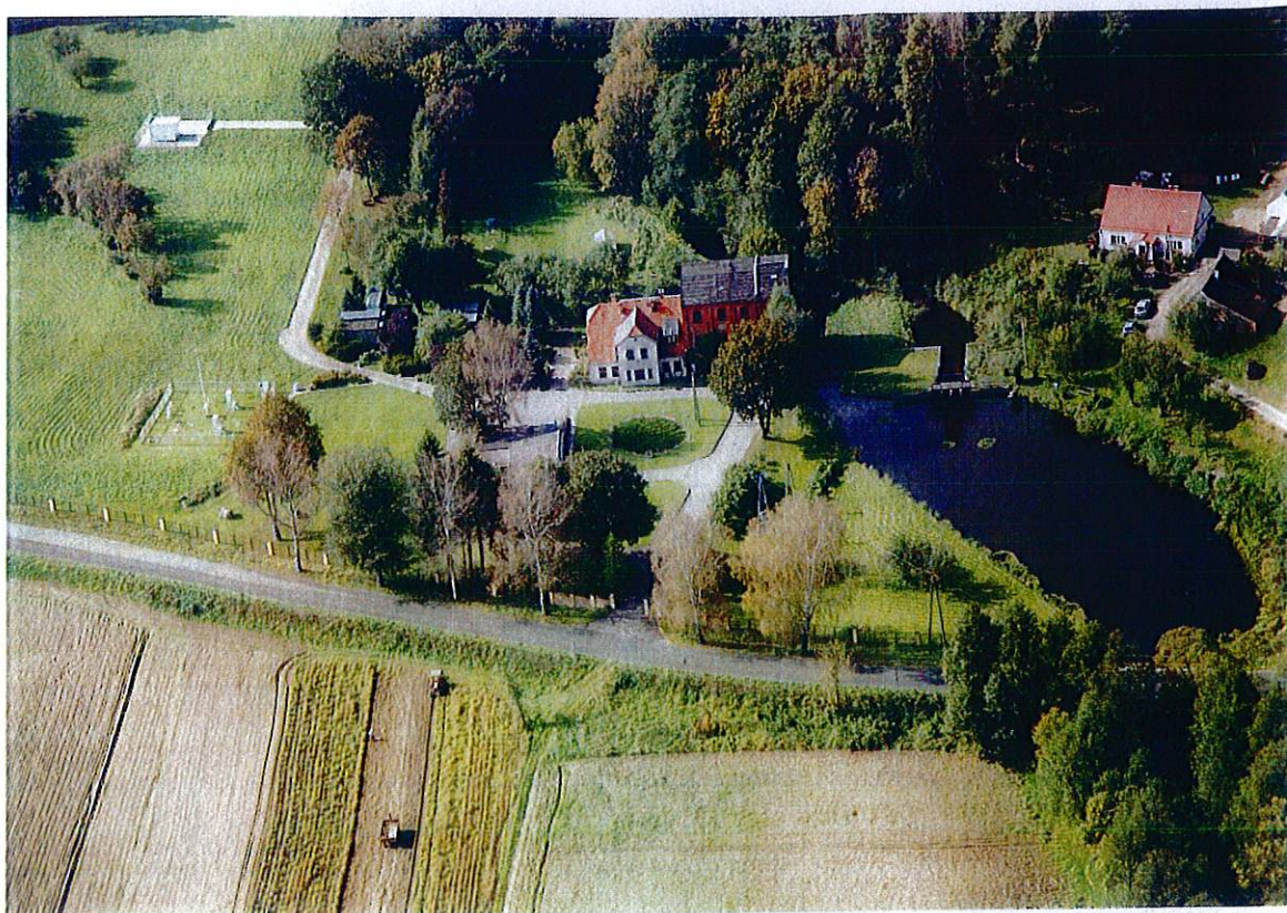
Rys. 8. Storkowo – Młyn. Ośrodek badawczy poznańskiego Uniwersytetu im. Adama Mickiewicza oraz prywatna elektrownia wodna.