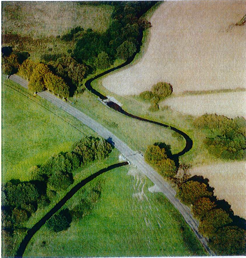
Rys.6. Rzeka Perznica w okolicach Grzmiącej

Przez naszą gminę przepływa 6 rzek, z których najważniejszą jest Parsęta zaliczana do najczystszych rzek w Polsce. W obrębie gminy znajduje się jej górny odcinek o długości ponad 20 km. Upodobili ją sobie głównie wędkarze i amatorzy spływów kajakowych. Pozostałe rzeki to: Perznica, Trzebiegoszcz, Łozica, Radusza, Kłuda.